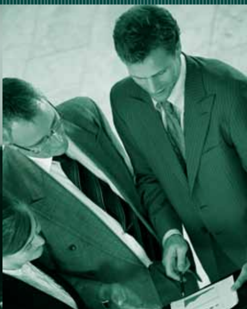
SVILUPPANDO E PROGETTANDO SOLUZIONI