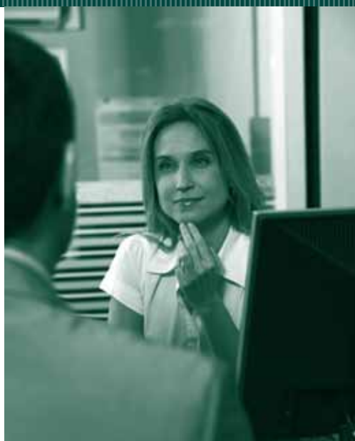
INTERPRETANDO LE ASPETTATIVE DEL CLIENTE