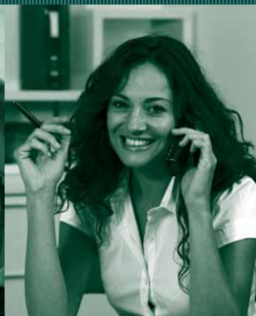
GARANTENDO LA TRANQUILLITÀ FUTURA DEL CLIENTE